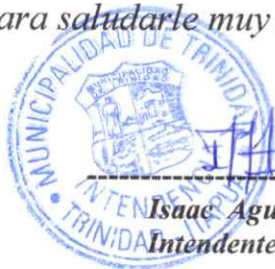
Isaac Aguilar Cuella Intendente Municipal