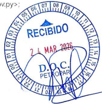
image001.jpg; NOTA DOC 147 _26.pdf; 03200.pdf;

Buenas tardes, su Nro. de Expediente es 3200