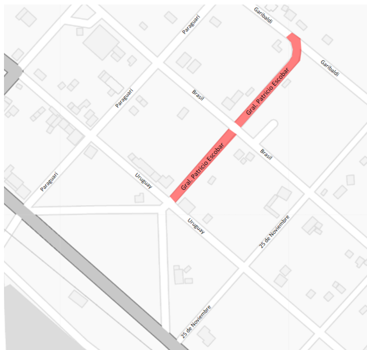
PLANTA UBICACION ___ S/E