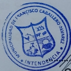
..... GILDO SOCOLOSKI INTENDENTE MUNICIPAL