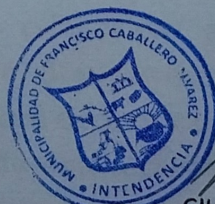
GILDO SOCOLOSKI Intendente Municipal