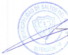
Héctor Fabián Morán Spejegys Intendente Municipal.