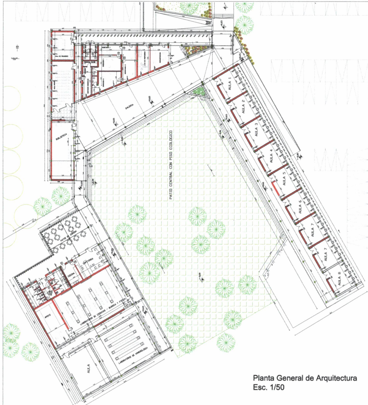
Planta General de Arquitectura Esc. 1/50