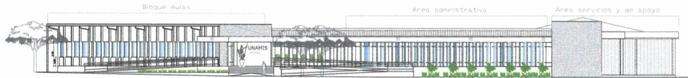
FACHADA SOBRE DOBLE AVENIDA SIN ESCALA