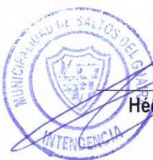
Héctor Fabián Morán Spejegs Intendente Municipal.