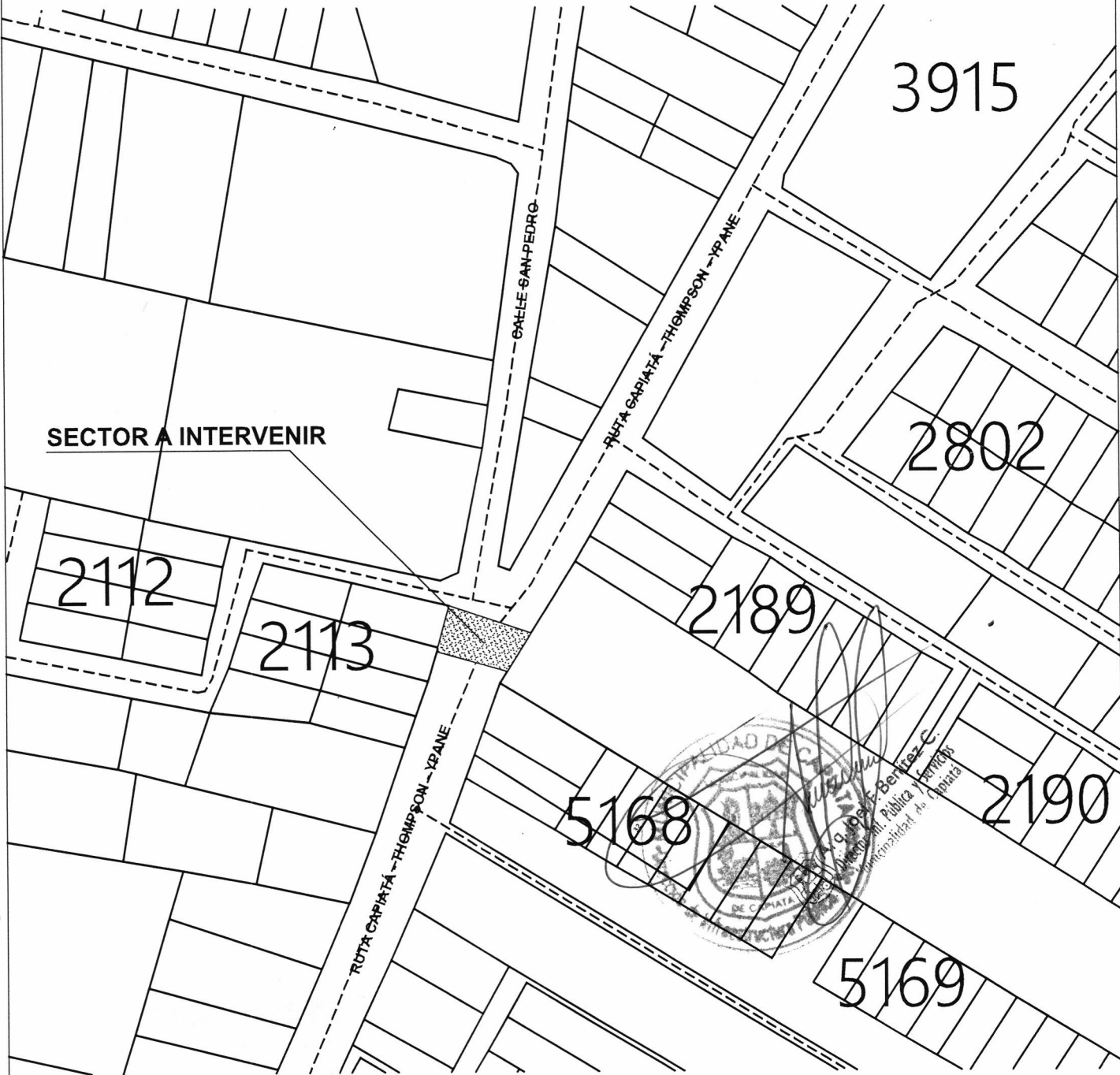
PLANTA DE UBICACIÓN ESC-----1/2.000