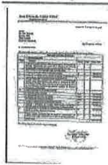
Jose Vallet Presupuesto.jpeg 175K

Jose Vallet <jevallet@rieder.net.py> Para: uoc essap <essapuoc@gmail.com>