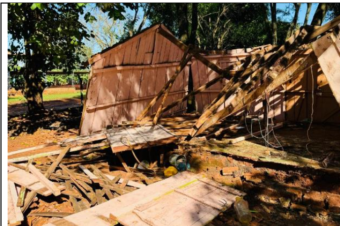
Cocina Derrumbada debido a Temporal

Se adjunta al presente evidencias fotográficas.