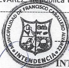
GILDO SOCOLOSKI INTENDENTE MUNICIPAL