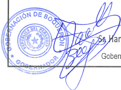
Sr. Harold Bergen Toews Gobernador Gobernación de Boquerón

Las causales y el procedimiento para suspender temporalmente, dar por terminado en forma anticipada o rescindir el contrato, son las establecidas en la Ley N° 7021/22, y en las Condiciones Contractuales de este pliego de bases y condiciones.