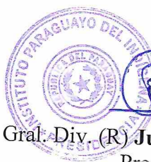
Gral. Div. (R) Juan Ramon Benegas F. Presidente Instituto Paraguayo del Indígena (I.N.D.I.) El Contratante

EN TESTIMONIO de conformidad se suscriben 2 (dos) ejemplares de un mismo tenor y a un solo efecto en la Ciudad de Asunción, República del Paraguay al día Cinco mes marzo y año dos mil veinticinco.