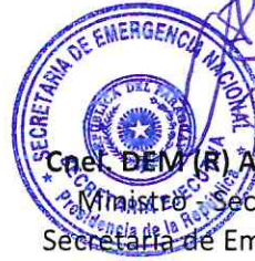
Cnel. DEM (R) Arsenio Zarate Ministro - Secretario Ejecutivo Secretaría de Emergencia Nacional

Misión: Gestionar y reducir los riesgos de desastres en el país a través de políticas con participación de actores y sectores, en beneficio de la ciudadanía apoyados en conocimientos y tecnología.