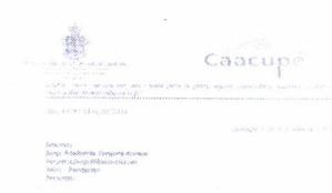
PDF NOTIFICACION JV ...

3 archivos adjuntos • Analizado por Gmail