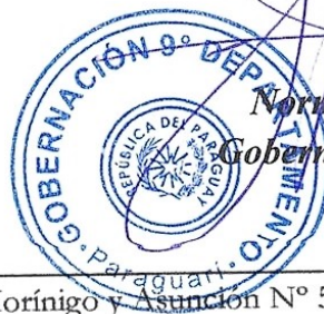
Norma Belén Zarate de Monges Gobernadora del IX Dpto. Paraguari