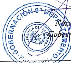
Norma Belén Zarate de Monges Gobernadora del IX Dpto. Paraguari