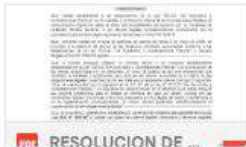
RESOLUCION DE ...