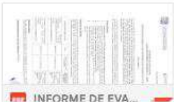
INFORME DE EVA...