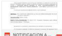
NOTIFICACION A ...