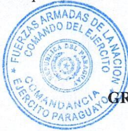
GRAL EJ MANUEL RODRÍGUEZ SOSA Comandante del Ejército

5° Comuníquese a quienes corresponda y cumplida archivar. -----