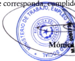
Mónica Recalde De Giacomi Mónica Recalde De Giacomi Ministra