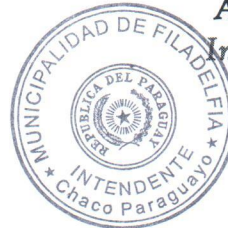
Abg. Holger Bergen Intendente Municipal

VISIÓN: "Ser una Institución modelo, con ciudadanos orgullosos de ella, promotora del desarrollo humano sostenible, con transparencia en gestión y administración de los recursos Municipales".